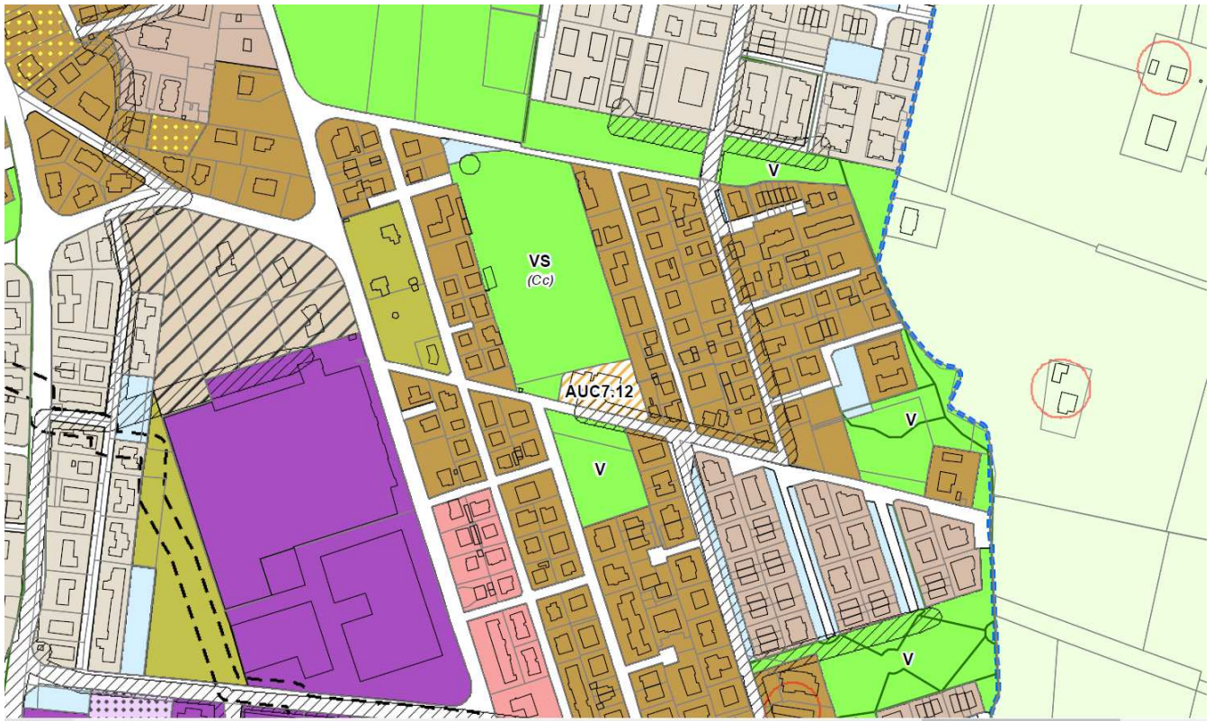
Tavola rue 1.5