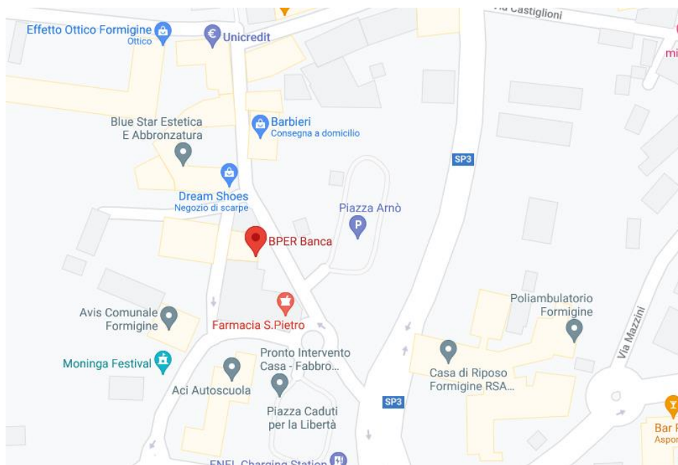
POSIZIONE DELLO SPORTELLO BPER BANCA ADIBITO A TESORERIA

Attenzione: ricordarsi di inviare una copia della ricevuta di pagamento al Servizio Cultura tramite e-mail all'indirizzo: giovani@comune.formigine.mo.it