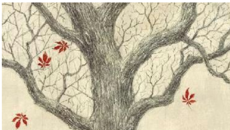
Tratto da L'albero di Anne - Orecchio Acerbo, 2010

la Biblioteca Ragazzi Matilda propone una selezione di titoli sul tema della Shoah