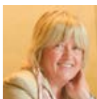
Sindaco MARIA COSTI

È stata inaugurata la Semiresidenza di Neuropsichiatria dell'infanzia e dell'adolescenza di Formigine, la struttura di via Giardini Nord denominata "La limonaia" in ragione della sua funzione storica, che verrà gestita direttamente dal Dipartimento di Salute Mentale dell'Azienda USL di Modena ed accoglierà minori tra gli 11 e i 17 anni che presentano difficoltà nelle aree delle autonomie, delle relazioni, delle competenze cognitive e sociali. Il centro sarà attivo dal lunedì al venerdì, e vi lavoreranno diverse figure professionali: neurop-