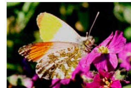
Aurora su Aubretia

Nelle foto sono ritratte alcune specie tipiche dei nostri territori, su alcune essenze a loro particolarmente gradite.