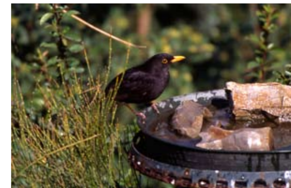
Punto d'acqua con merlo