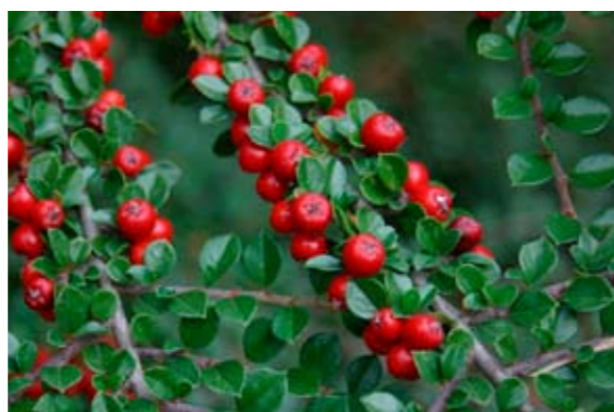
Frutti di cotoneastro

La fitta vegetazione spinosa offre siti ideali per la costruzione del nido.