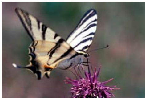
Podalirio su Cardo