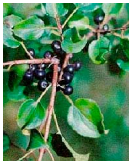
Frutti di spino cervino