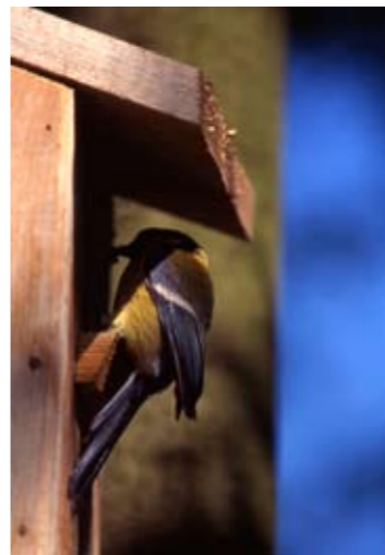
Nido artificiale con cinciallegra