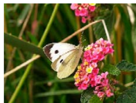
Cavolaia maggiore su Verbena