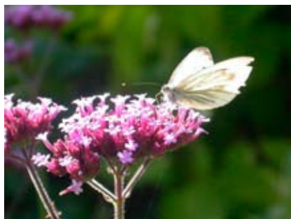
Navoncella su Verbena