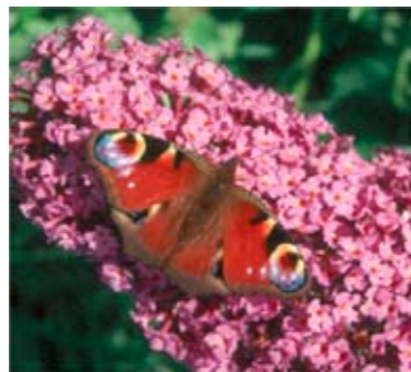
Vanessa io su Buddleja