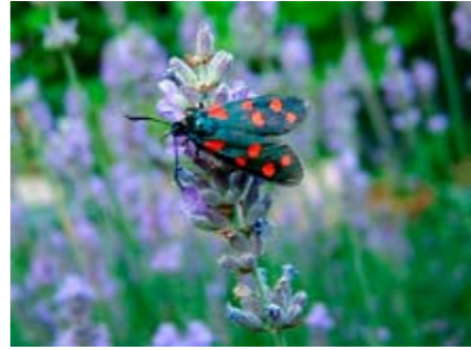
Zigane su Lavanda