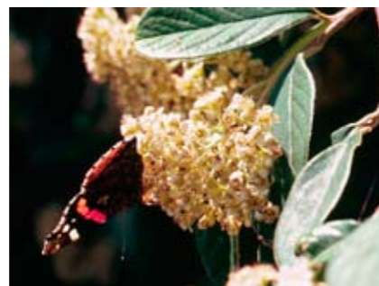
Vanessa Atalanta su Cotoneastro