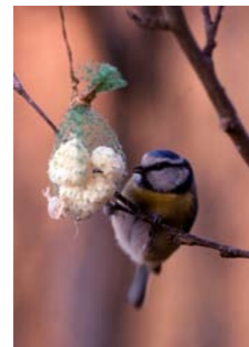
Mangiatoia a rete con cinciarella