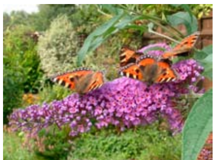
Vanesse dell'ortica su Buddleja