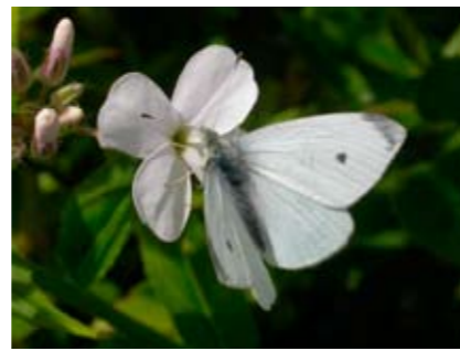
Cavolaia minore su Violacciocca