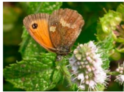
Pyronia tithonus su Menta