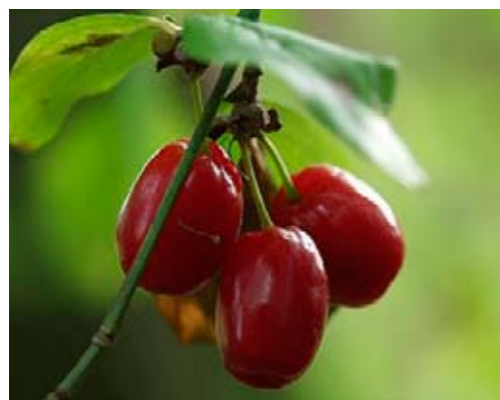
Frutti di corniolo

Farnia, Gelso nero, Acero campestre, Albero di Giuda.